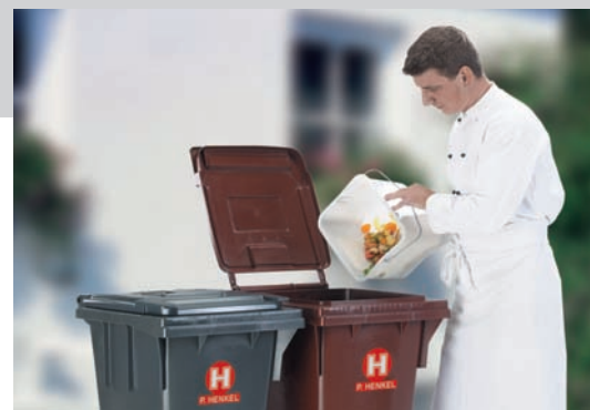
Прием биомусора в МК 120 л со сферическим дном