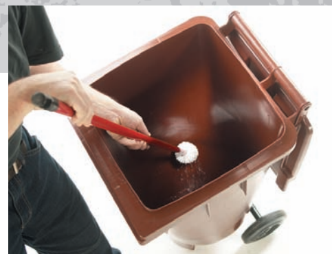
Легко очищаются в ручную щеткой