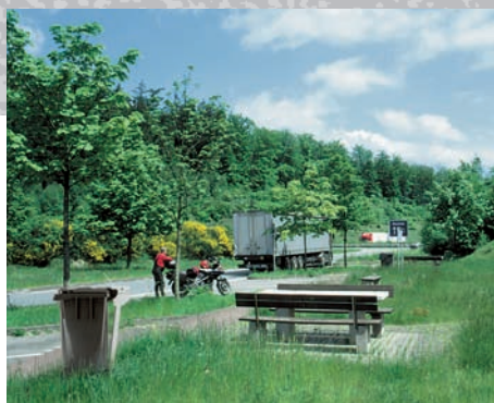
МК 120 л со сферическим дном в местах отдыха