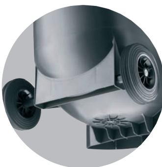
Стабильное сферическое дно с опорой