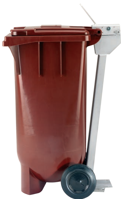
МК с оцинкованным металлическим замком