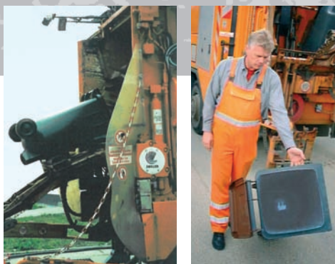
Быстрая машинная выгрузка без остатков